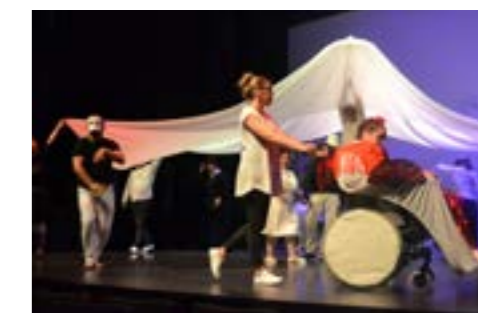
Service de la communication