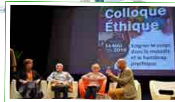
Témoignages de familles de l'UNAFAM