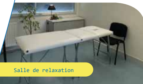
Salle de relaxation