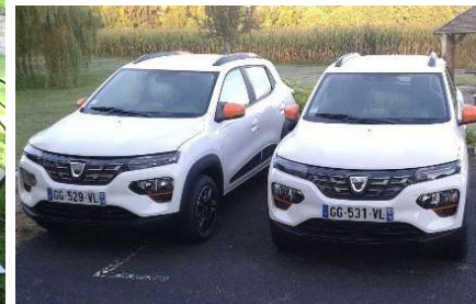
Véhicules électriques du CHCC