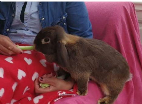
Médiation animale