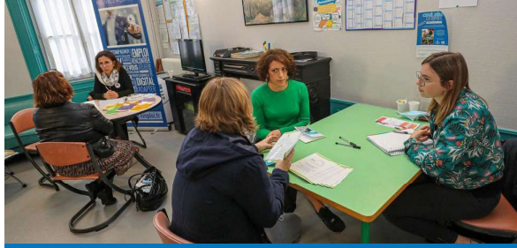
SISM "Portes ouvertes CRÉHAB'16"