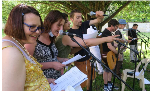
Déjeuner sur l'herbe