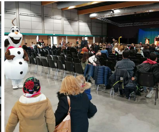
Arbre de Noël du personnel