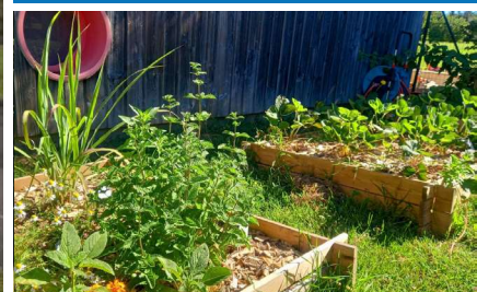
Le "Jardin des partages"