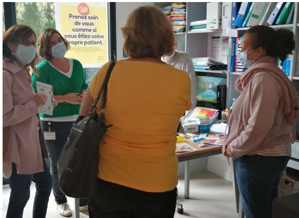
SISM "Portes ouvertes CMP/CATTP Cognac"