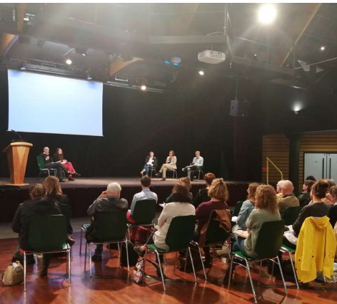
SISM "Forum lien ville-hôpital"