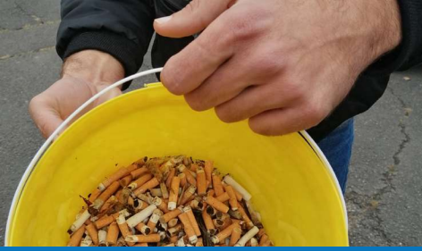
SISM "Ramasse ton mégôt"