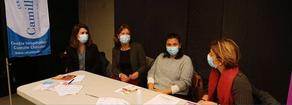
Forum Parentalité, Espace Carat à Angoulême