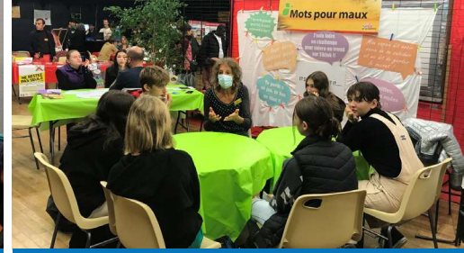
Forum Santé - Espace Franquin à Angoulême