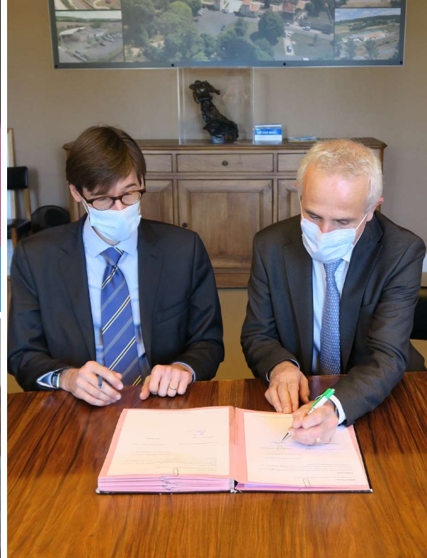
Signature convention CHCC/HGC